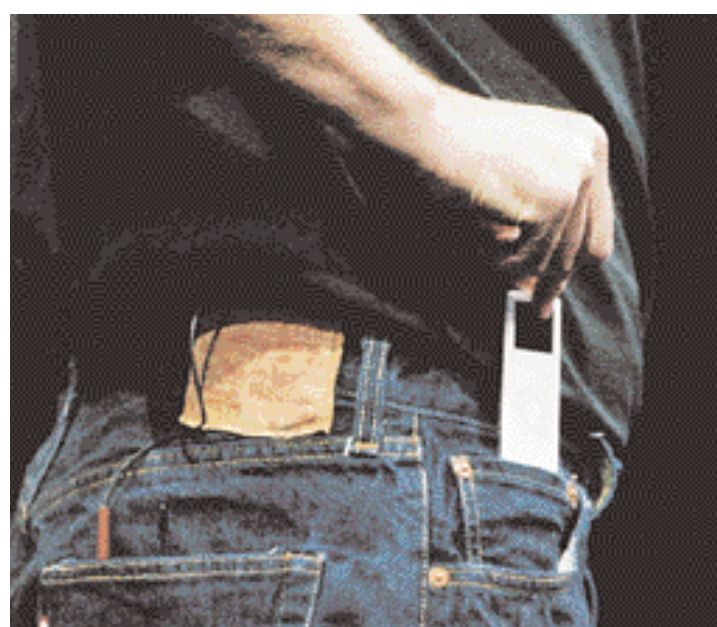
Wenn es so weitergeht, wird der iPod von Apple bald unsichtbar.

Im Inneren befindet sich nicht mehr eine Festplatte, sondern ein so genanntes Flash-Memory als Speicher für das Äquivalent von bis zu 70 Musik-CDs. Die neu verwendete Technologie arbeitet lautlos,